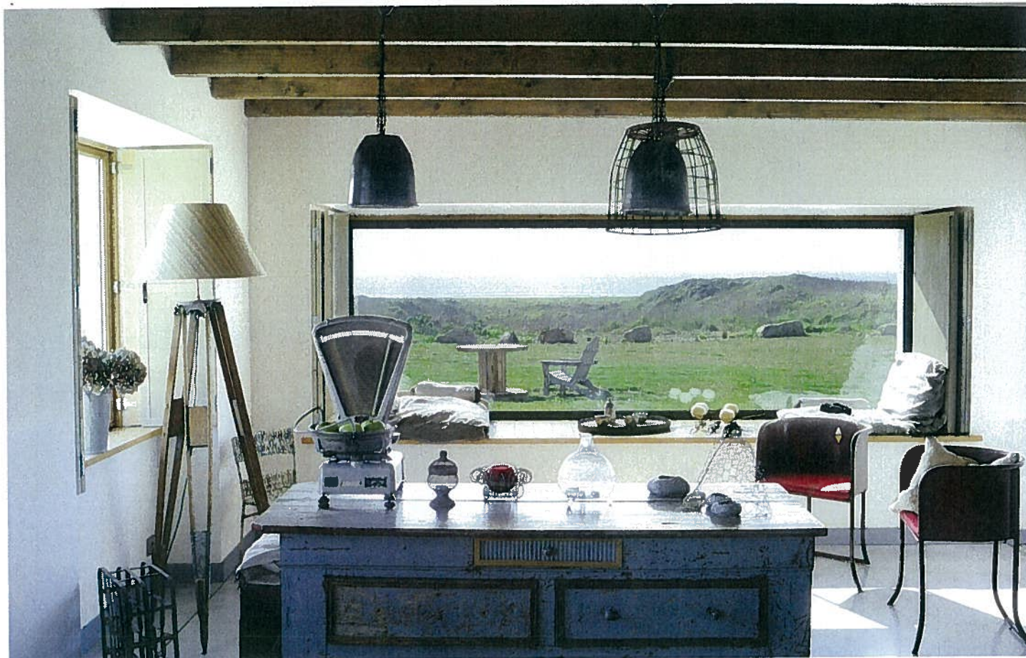
Un comptoir de mercerie éclairé par deux moules à glace détournés en suspension marque la transition entre le coin repas et le séjour ouvert sur l'extérieur par une fenêtre panoramique. Panier à pommes, moules à glace et comptoir, Brocante de l'église à Plonéour-Lanvern.

Seule face à l'océan, dans un environnement naturel préservé, la maison, exposée sud-ouest, bénéficie d'un bel ensoleillement tout au long de la journée.