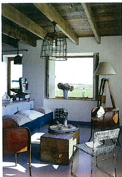
Sous la suspension – un ancien panier à pommes en métal –, le coin salon invite à la détente autour d'une malle de voyage transformée en table basse.