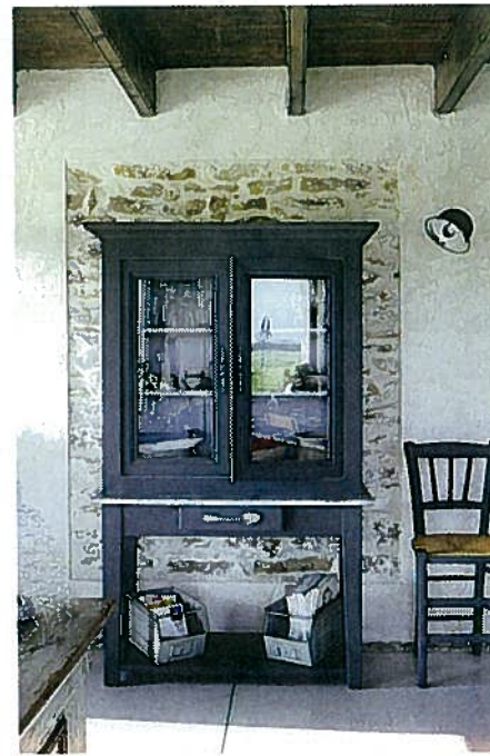
Dégarni de son enduit, le mur découvre ses pierres pour marquer l'emplacement du buffet deux corps, poncé et peint. Applique Jieldé.