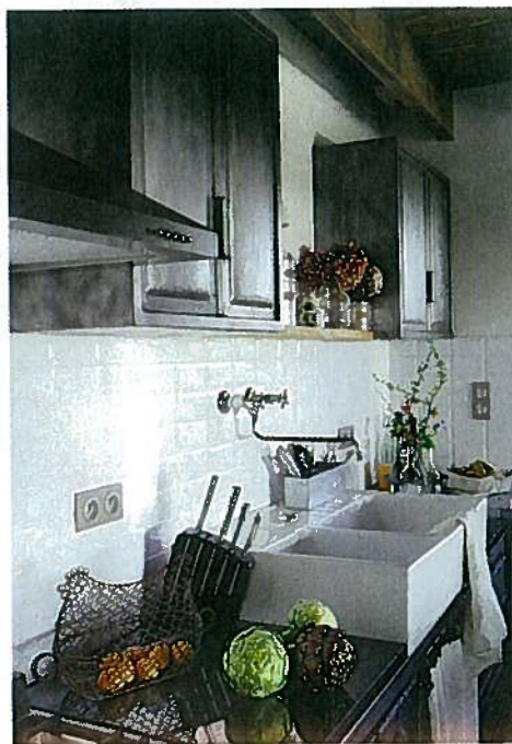
Un meuble de métier (Antiquités Quiniou à Pont-l'Abbé), revêtu de plaques de marbre noir, sert de plan de travail et accueille l'évier double.